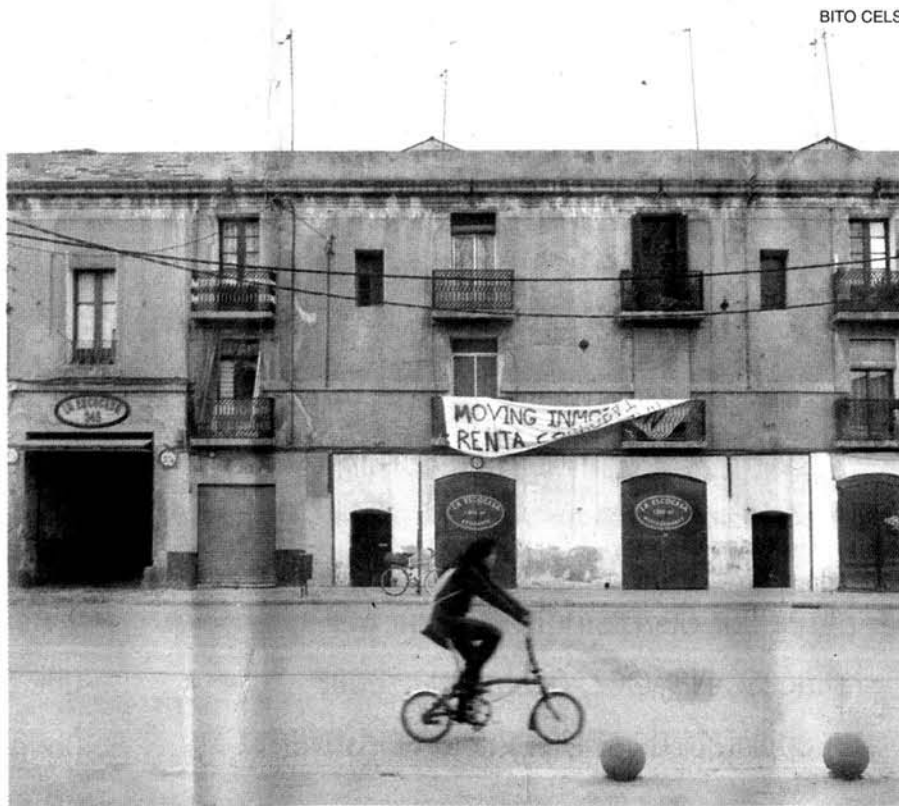
Alguns veïns han penjat pancartes de protesta a la façana dels pisos del recinte fabril a Pere IV.

La nova Associació de Veïns, Artistes i Artesans durà a terme una «primera campanya» per «demandar que es respecti els drets dels inquilins» i una «segona per reivindicar nous espais per als artistes». De moment, l'associació anuncia «diverses activitats», entre les quals hi ha espectacles teatrals, de circ i mostres de pintura. Segons Mataró, els espectacles tindran lloc a partir dels dies 18 o 25 de març, tant a L'Escocesa com a la placeta del Sagrat Cor.