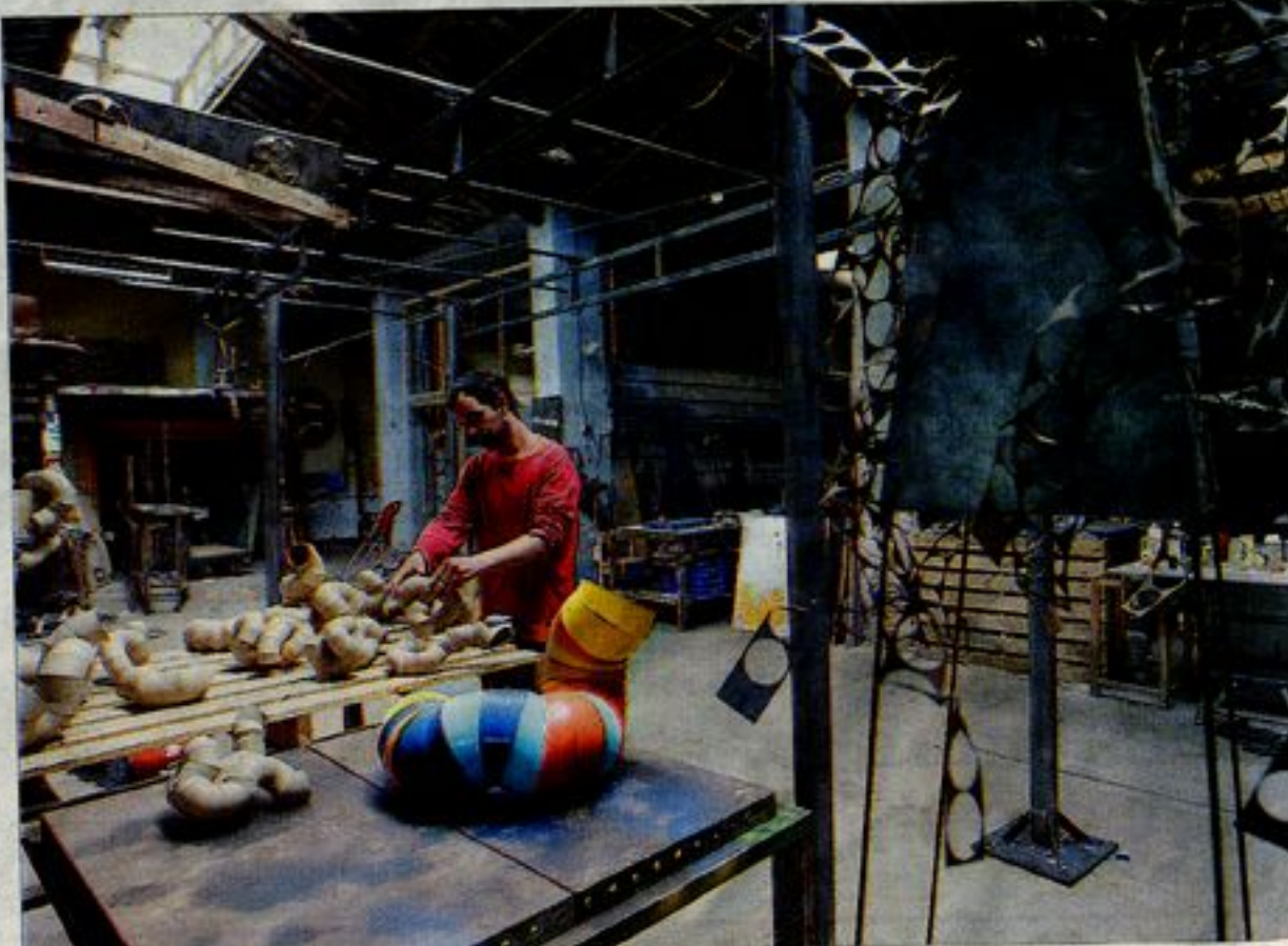
►► Un artista treballa en un dels espais de l'antiga fàbrica La Escocesa, dissabte passat.